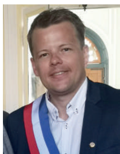
Paul-Loup TRONQUOY Maire de Bergues